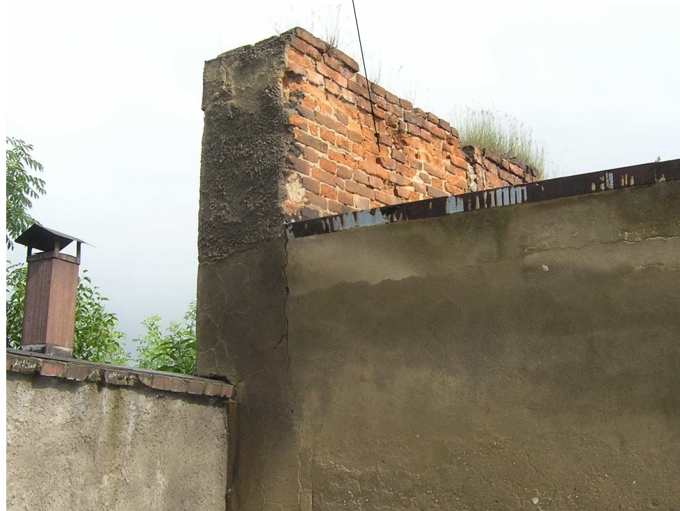
fot. 17 Biała - odcinek miejskich murów obronnych przy ul. Szkolnej Wewnętrzne lico muru - przemurowany styk po baszcie

wątek nieregularny, cegła ręcznie formowana, wątek główkowo - wozówkowy (XVII-XVIIIw.)